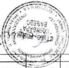
Таблица за посрещане на кой се намира същият